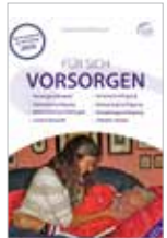
Vorsorgegmappe „Für sich vorsorgen“ kostenfrei (zzgl. Versandkosten)