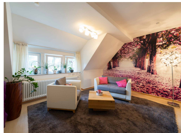
Raum der Stille