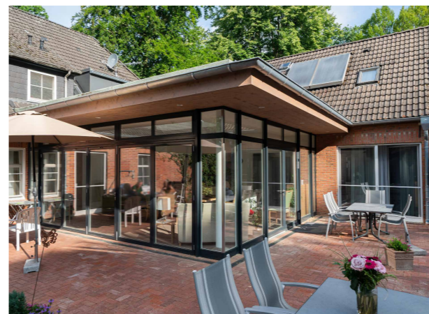
Terrasse an der Wohnküche